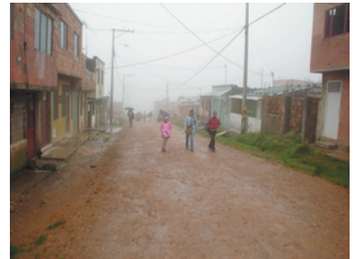
Barrios Sin Legalizar