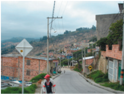
Sin Inversión - Barrios Sin Legalizar 21