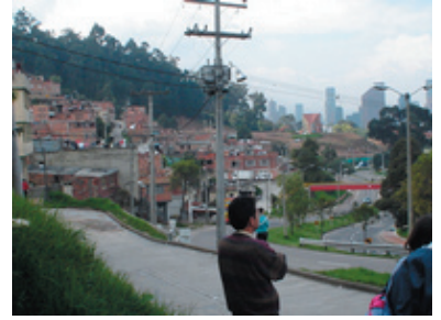
Sin Inversión - Barrios Sin Legalizar 20

Además: La proliferación de antenas en la UPZ Pardo Rubio ha provocado una fuerte contaminación electromagnética en la población local. Igualmente, las quebradas se encuentran contaminadas particularmente por la presencia de residuos sólidos.