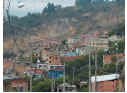
Viviendas en zonas de alto riesgo 23

Además: la depreciación en el avalúo catastral de los predios, lo cual va en contra de las familias, produciendo posiblemente detrimento patrimonial. Igualmente hay una pérdida del derecho a la tranquilidad y un daño físico y emocional provocado por la angustia y la zozobra respecto del futuro, lo cual afecta el denominado índice de la esperanza como factor de desarrollo.