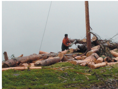
Extracción de recursos sin inversión